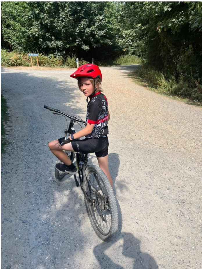
Faas tijdens het 'aanharken' van Bedgebury Forest in Groot-Britannië.