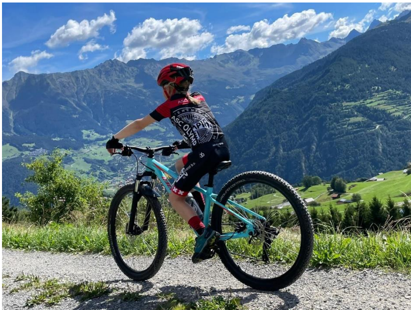
En daarna knallend naar beneden..